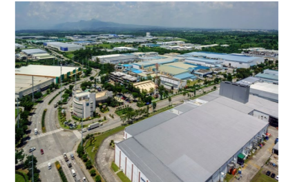
【工業団地俯瞰写真】