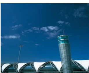
スワンナプーム新空港