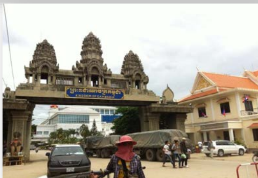
<写真左:ポイペト国境>