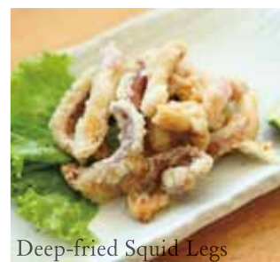
Deep-fried Squid Legs