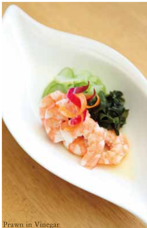
Prawn in Vinegar