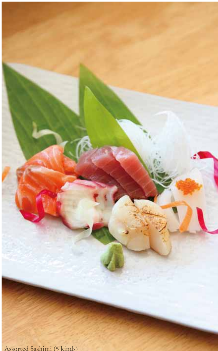
Assorted Sashimi (5 kinds)