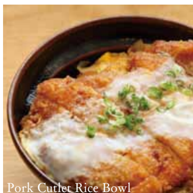
Pork Cutlet Rice Bowl