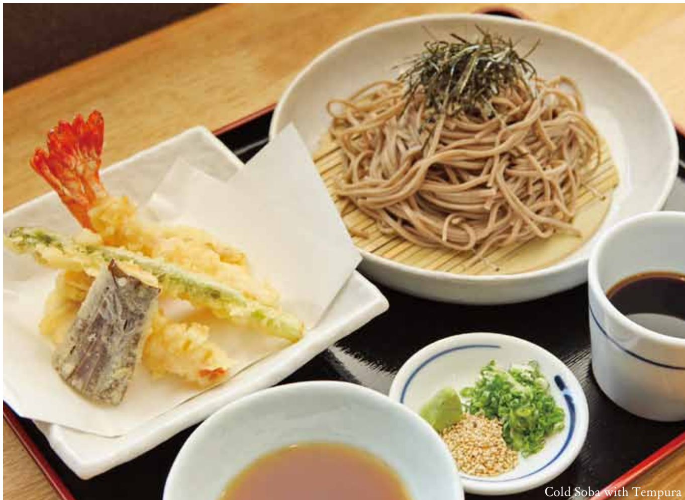
Cold Soba with Tempura