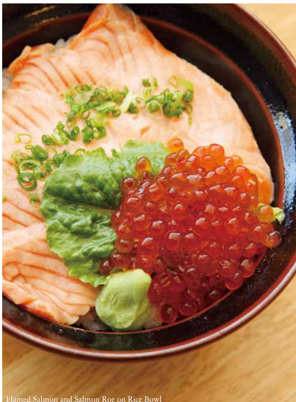
Flamed Salmon and Salmon Roe on Rice Bowl

Chawan Mushi 83 茶碗蒸し $2.00 Steamed Egg Custard