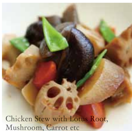
Chicken Stew with Lotus Root, Mushroom, Carrot etc

Nikujaga 41 肉じゃが $3.50 Meat & Potato Stew