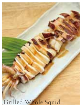
Grilled Whole Squid