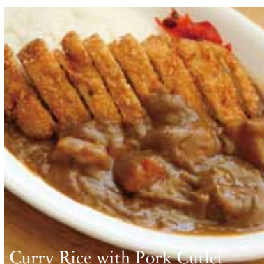
Curry Rice with Pork Cutlet

Onigiri (Ume, Sake, Okaka) 79 おにぎり (梅、鮭、おかか) 各 $1.50 Japanese Rice Ball (Plum, Salmon, Dried Bonito)