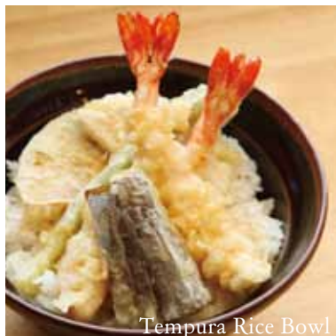
Tempura Rice Bowl