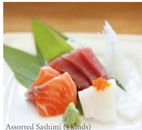
Assorted Sashimi (3 kinds)