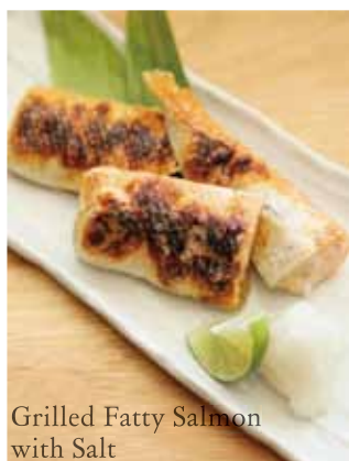
Grilled Fatty Salmon with Salt