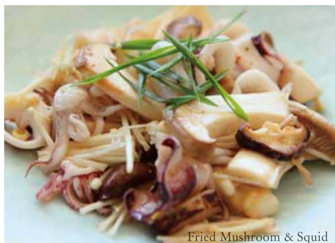
Fried Mushroom & Squid

Buta Kimuchi Itame 34 豚キムチ炒め $4.00 Pork Fried with Kimchi