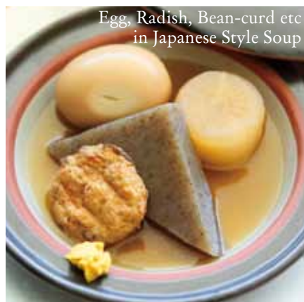
Egg, Radish, Bean-curd etc in Japanese Style Soup