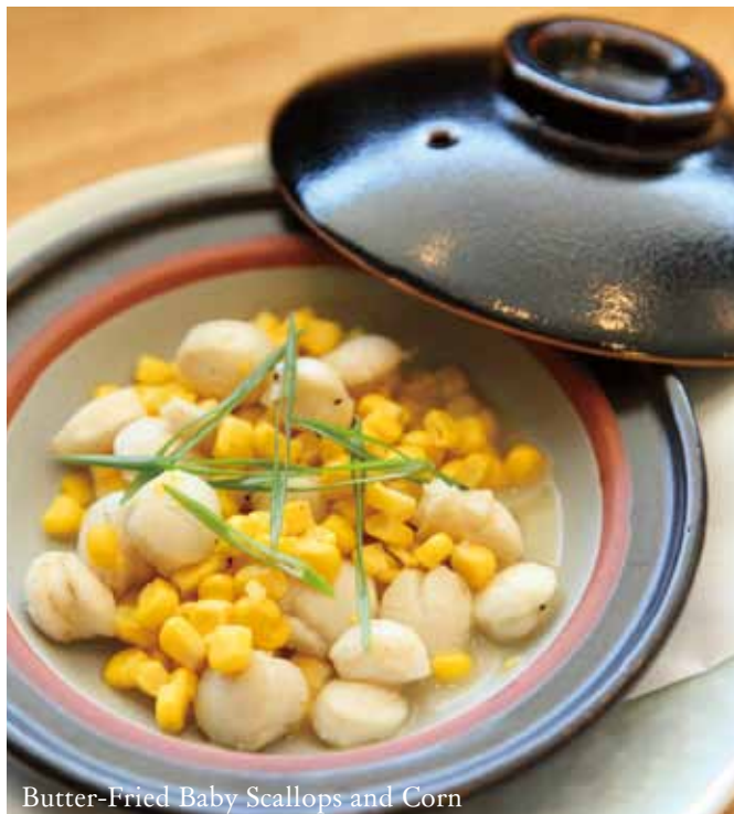
Butter-Fried Baby Scallops and Corn

Nira Moyashi Itame 35 なら・もやし炒め $3.50 Fried Leek & Bean Sprouts