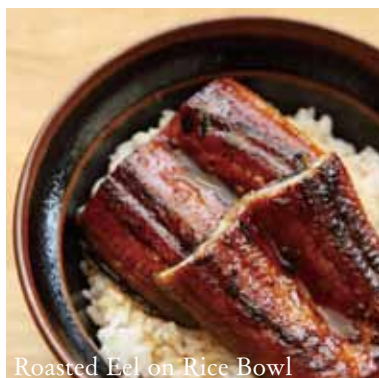
Roasted Eel on Rice Bowl