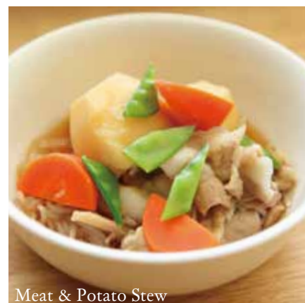
Meat & Potato Stew