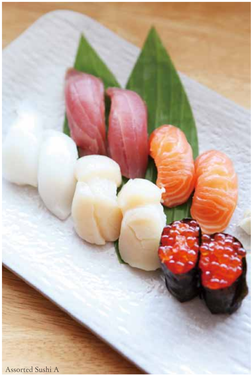
Assorted Sushi A