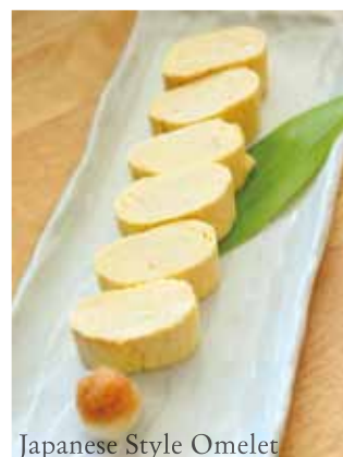
Japanese Style Omelet