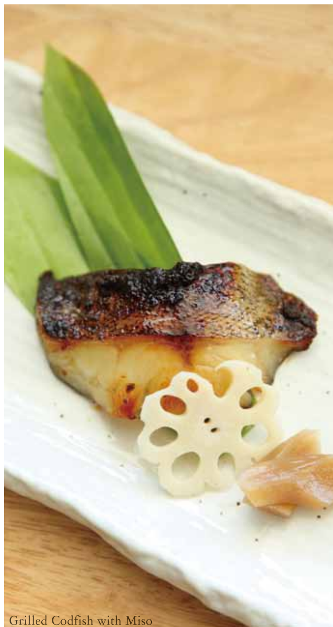
Grilled Codfish with Miso