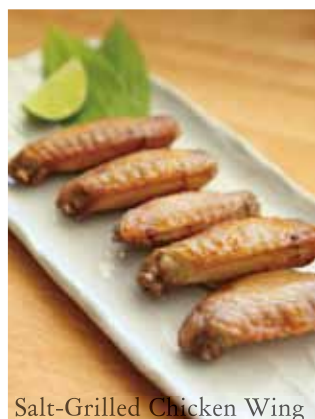
Salt-Grilled Chicken Wing